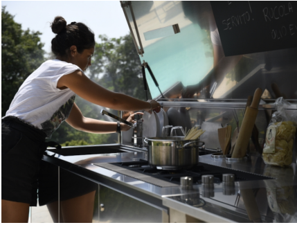
Finalmente, das Leben im Freien